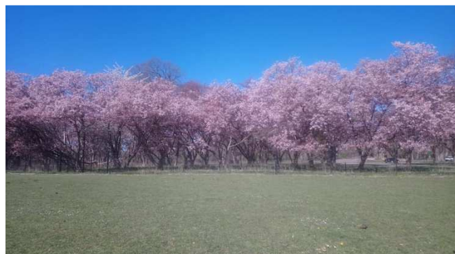
Blomstrende træer i Knuthenborg Park.