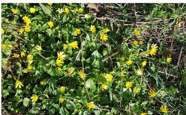
Vorterod i blomst.