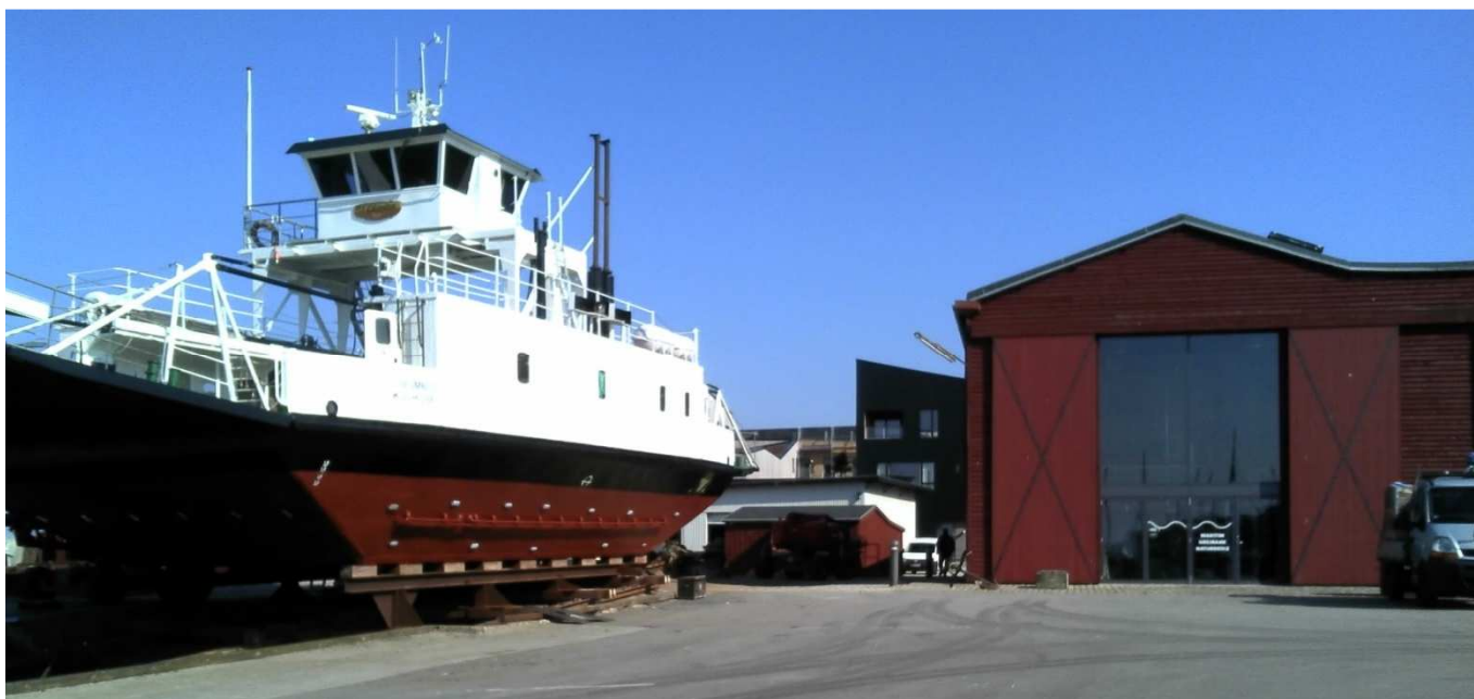
Et billede af en meget stille Værftshal