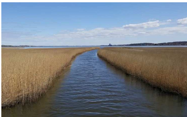
Tuse Å's udløb i Holbæk Fjord.