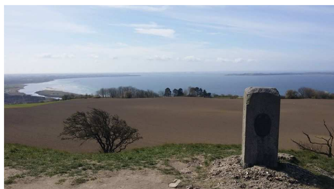
Udsigt fra Vejrhøj.