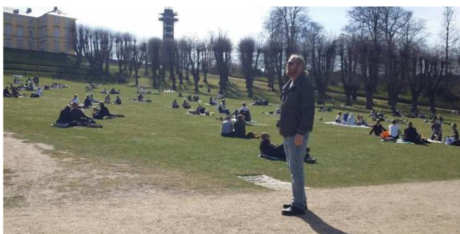
Frederiksberg Have (med afstand).

Som det ses på denne side, er ikke alle vore medlemmer ophørt med at gå ture, men det foregår alt sammen i privat regi.