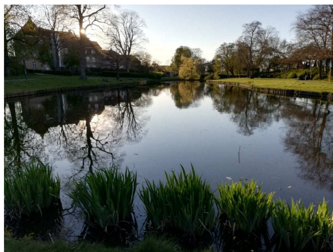
Fra Østre Anlæg i Holbæk