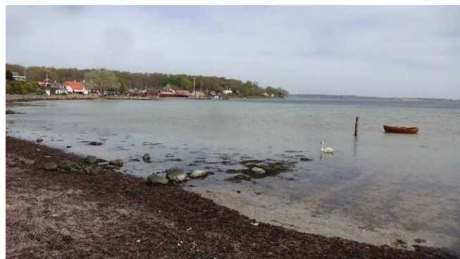
Fra Det Sydfynske Øhav.