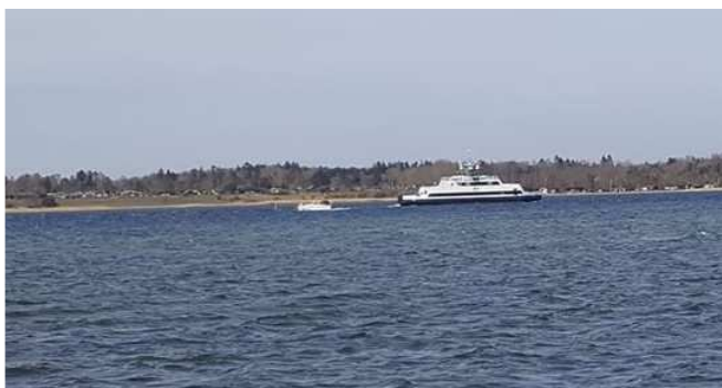
Orø-færgen i Holbæk Fjord.