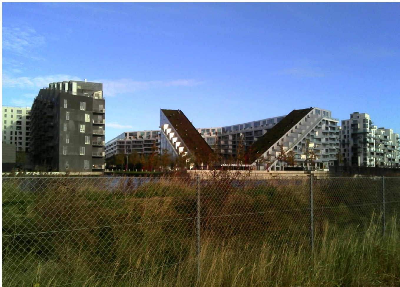
Vestamager november 2017