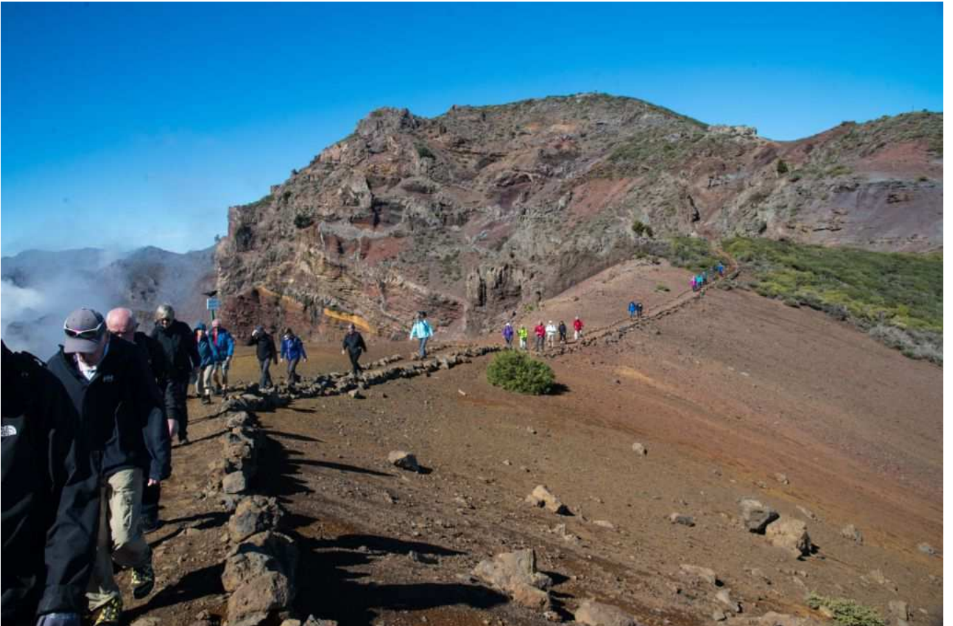
Fra Vandreugen på La Palma, januar 2018