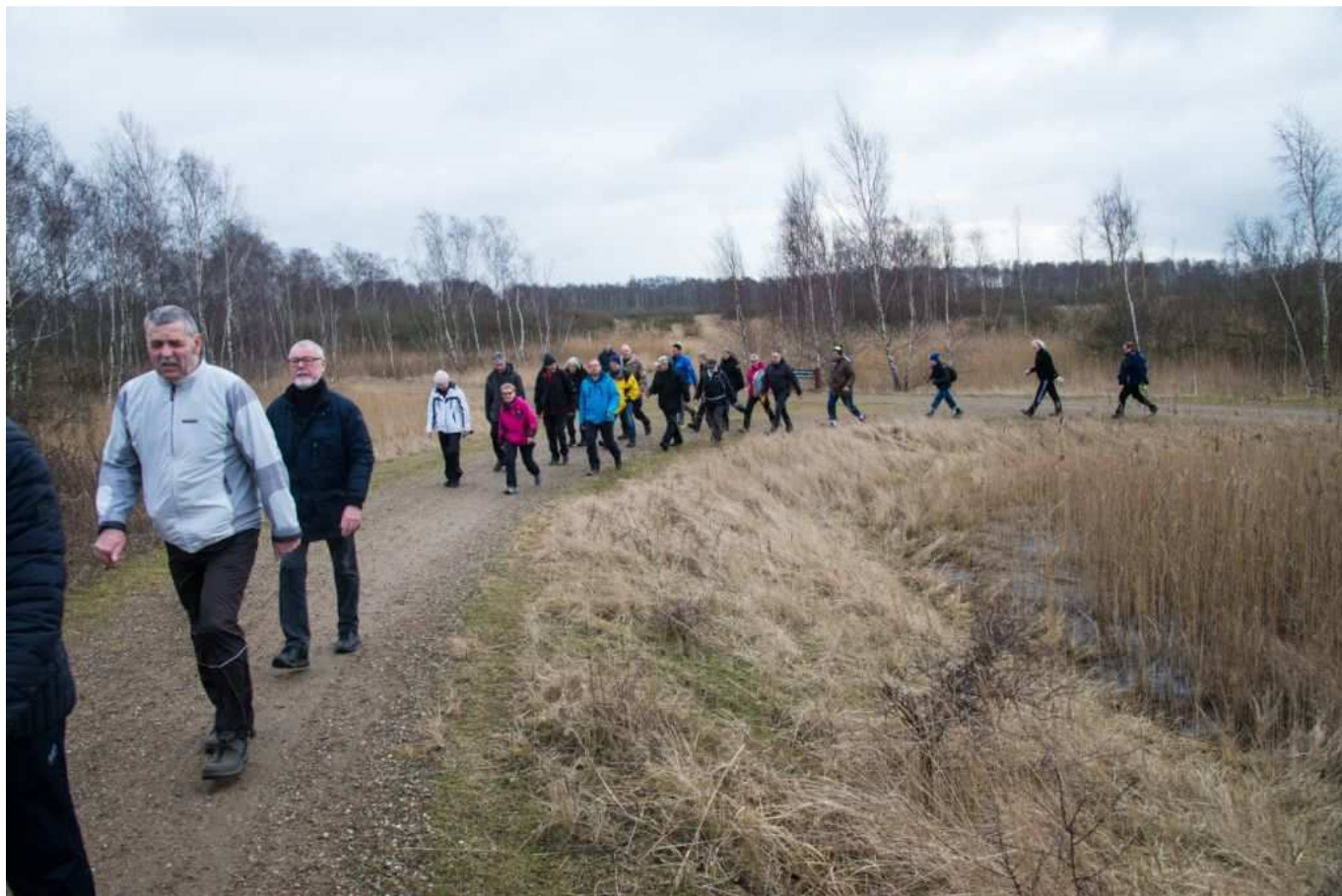
Fra Euraudax-turen på Amager februar 2018