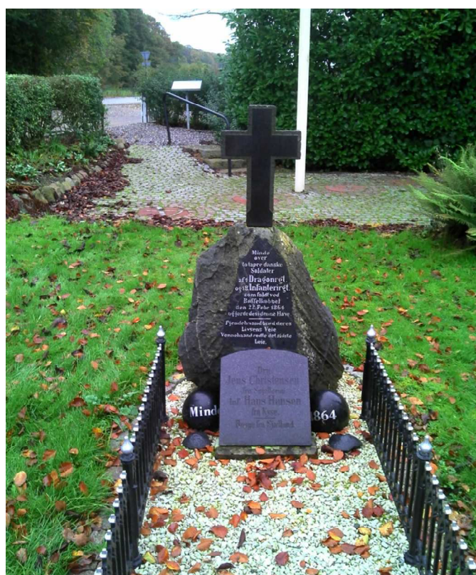
Teglværksvandring oktober 2017