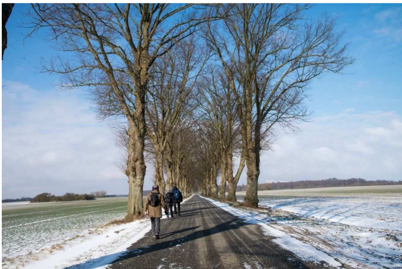
Fra Køge Å-sti Vandring, januar 2018