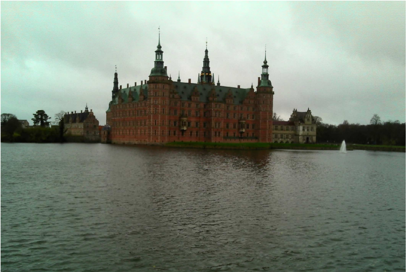
Fra Slotsvandring ved Hillerød, november 2017